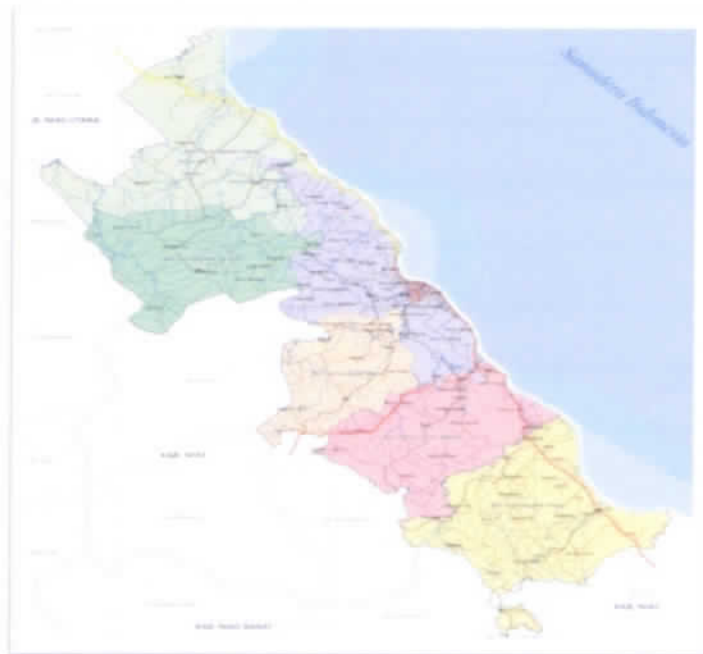
Gambar 1. Peta Kota Gunungsitoli