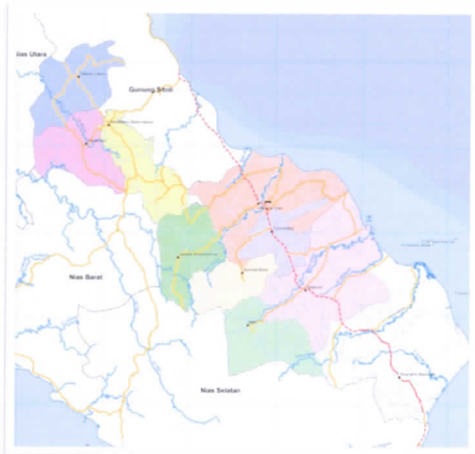
Gambar 2. Peta Kabupaten Nias