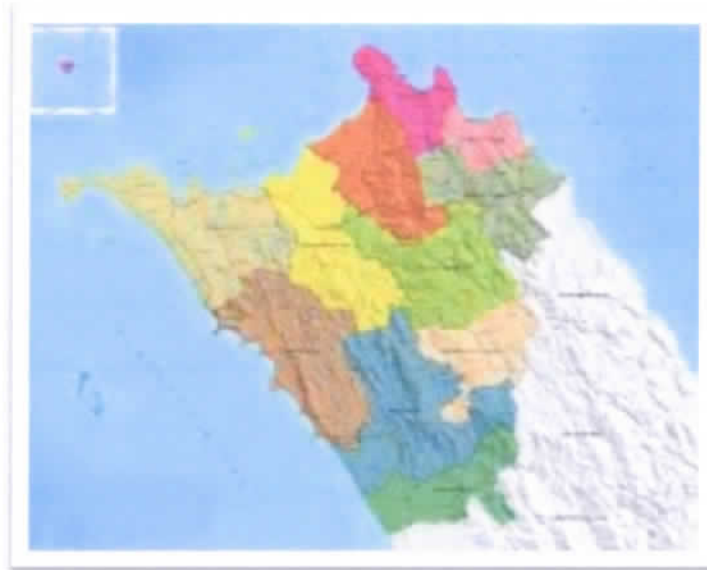
Gambar 3. Peta Kabupaten Nias Utara